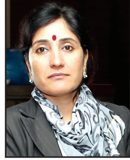
यशोदादेवी तिम्सिना सूचना आयुक्त