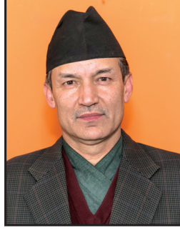
कृष्णहरि बाँस्कोटा प्रमुख सूचना आयुक्त