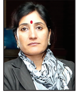
यशोदादेवी तिम्सिना सूचना आयुक्त